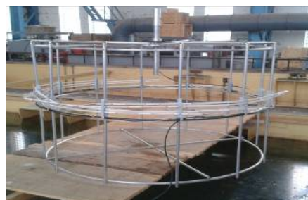
Рис. 2. Чувствительная часть антенны размещена на металлическом каркасе перед погружением в бассейн.